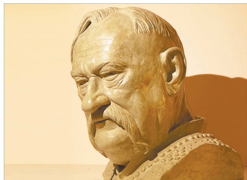
Богдан Ступка в образе Тараса Бульбы