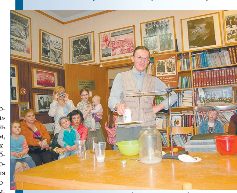
Научные сотрудники ОИЯИ продемонстрировали интересные эксперименты

«Ночь музеев» – международная акция, основной целью которой является демонстрация возможностей и потенциала современных музеев, привлечение в них молодой аудитории. Впервые такое мероприятие было проведено в 1997 году в Берлине. Российские музеи присоединились к акции с середины двухтысячных. 17 мая «Ночь музеев» была проведена в Дубне.